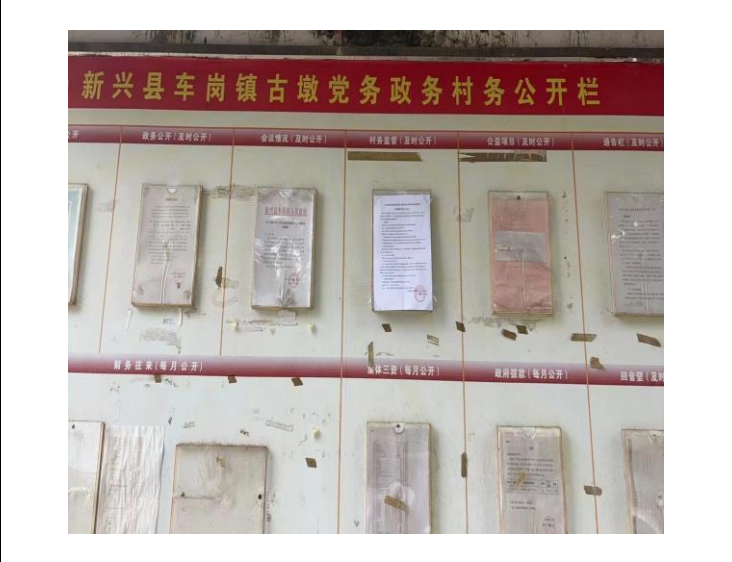
古墩村第二次公示