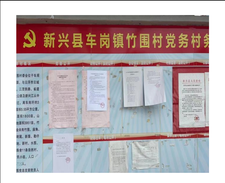
竹围村第二次公示